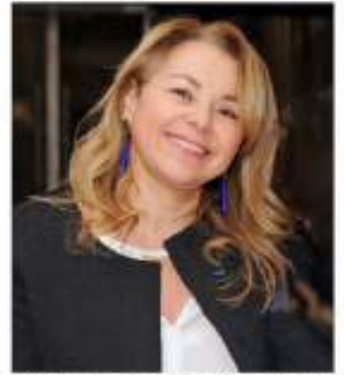
Fondatrice des Trophées Défis RSE

Car il n'y a pas de RSE sans engagement sociétal et éthique.